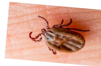
Kleszcz przed ukąszeniem