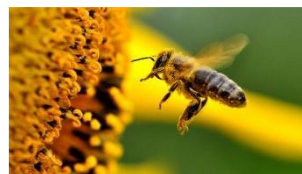
Pszczoła zapylająca kwiat

na dwór należy dokładnie posprządać czy nie mamy na sobie kleszcza. Przy ugryzieniu tego owada powinniśmy go czym prędzej usunąć i odczekać. Gdyby pojawił się rumień dookoła ukąszenia należy skontaktować się z lekarzem. Są owady, które są dla nas niekorzystne, ale również istnieją pożyteczne, takie jak pszczoły, które zapylają kwiaty i robią miód. Możemy im pomóc nie niszcząc roślin, stosując naturalne nawozy czy budując dla nich schronienie.